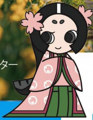
小桜ちゃん 小野町公式キャラクター

(東京都千代田区有楽町2丁目10番1号 東京交通会館8階) JR・地下鉄各線「有楽町」駅より徒歩1分